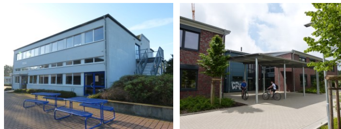
Das Hauptgebäude (oben), das Nebengebäude (u.l.), das Jahrgangshaus (u.r.)